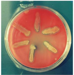
Hemolysines de Staphylococcus aureus